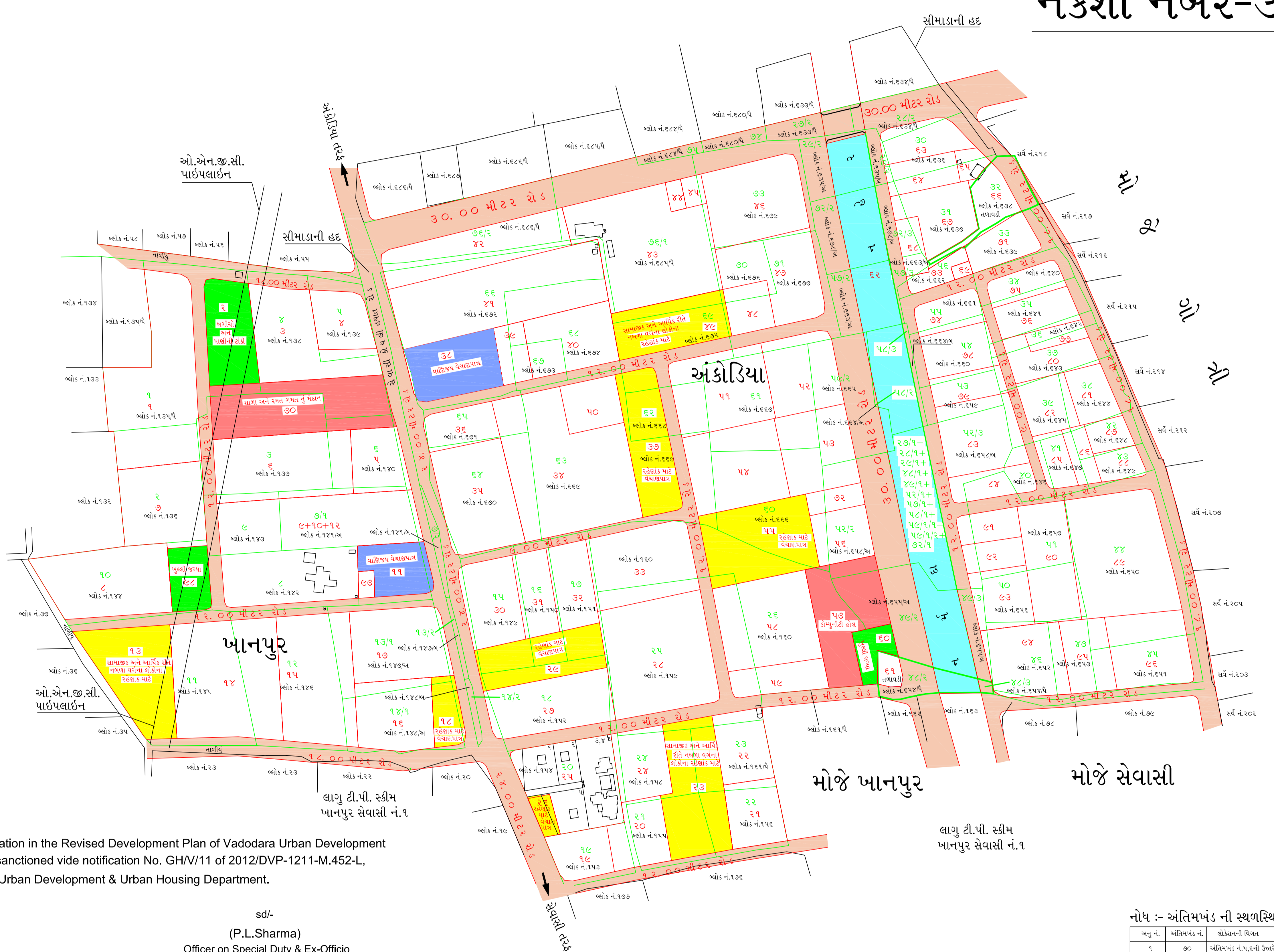
Plan showing modification in the Revised Development Plan of Vadodra Urban Development Authority, Vadodra sanctioned vide notification No. GH/V/11 of 2012/DVP-1211-M.452-L, Dated.18.01.2012 of Urban Development & Urban Housing Department.